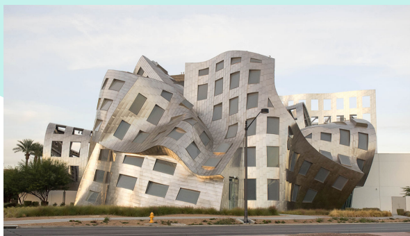
Franck Gehry : Lou Ruvo Center for Brain Health, Las Vegas, 2010