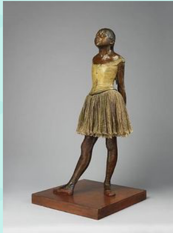
Edgar Degas, La Petite Danseuse de quatorze ans, sculpture réalisée en cire entre 1875 et 1880. 98 × 35,2 × 24,5 cm. National Gallery of Art de Washington.