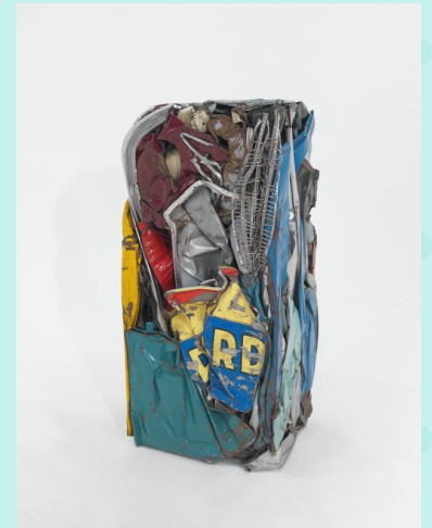
César, Compression « Ricard », 1962. 153 x 73 x 65 cm, Tôle d'acier laquée compressée. Centre Pompidou, Paris.