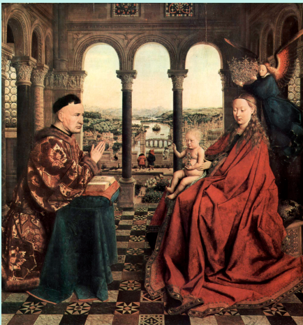
Jan Van Eyck, La vierge du chancelier Rolin, vers 1435. 66 × 62 cm, Huile sur toile. Musée du Louvre, Paris.