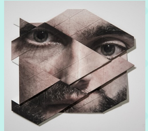
Les origamis photographiques de l'artiste Aldo Tolino