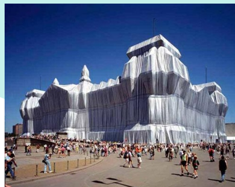
Christo et Jeanne-Claude, l'emballage du Reichstag, Berlin, du 23 juin au 7 juillet 1995.