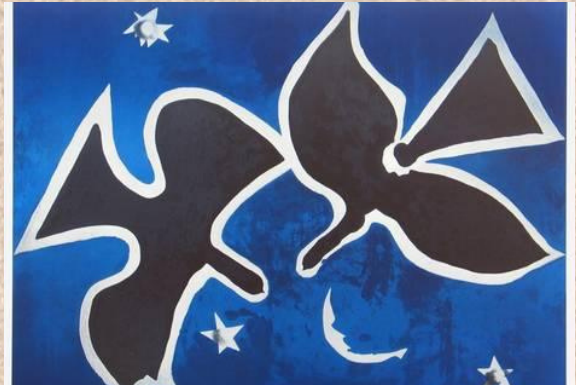
Georges Braque, Les Oiseaux, 1953-54.