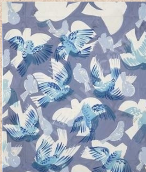
Raoul Dufy, composition aux oiseaux, 1929