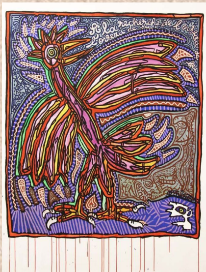
Robert Combas, A la recherche de l'oiseau de feu, 1987