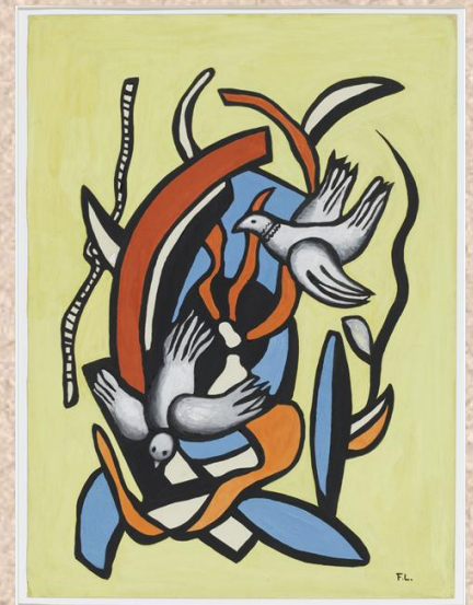
Pablo Picasso, colombe de la paix