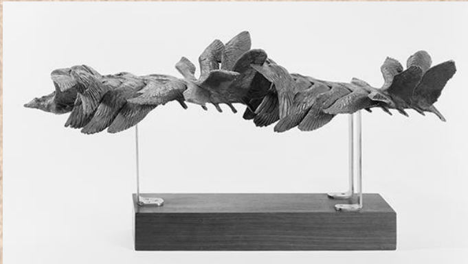
MAREY Etienne-Jules), L'envol du goéland, moulage de plâtre, 1887.

Représenter l'instant de l'affrontement. La couleur doit témoigner de l'animosité des oiseaux.