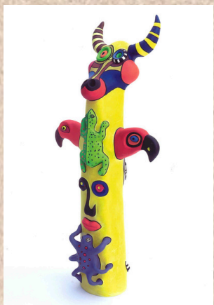
Niki de St Phalle, Bull Head, 2001