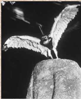
Totems Joan Fontcuberta, Fauna, 1985-89

Feuille de dessin format A5, crayon à papier et café.