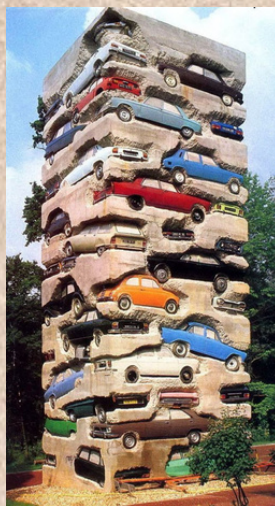
Arman, Long Term Parking, 1982. 1950 × 609,6 × 609,6 cm