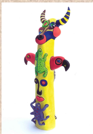
Niki de St Phalle, Bull Head , 2001