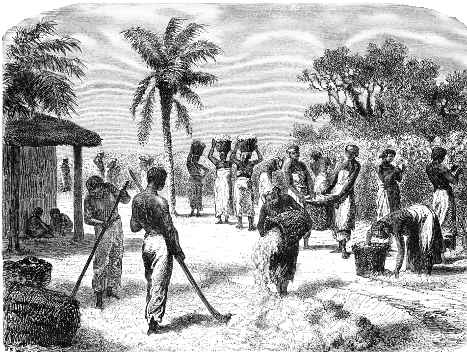
Esclaves d'origine africaine, en train de travailler dans une plantation de coton, aux États-Unis, au 19e siècle.

Le 10 mai, c'est la Journée nationale des mémoires de la traite, de l'esclavage et de leurs abolitions . Une historienne nous explique l'importance de cette journée de commémoration.