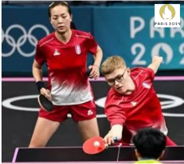
Tennis de table Double mixte