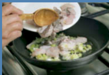
Unite la cernia al soffritto facendola saltare a fuoco vivo.