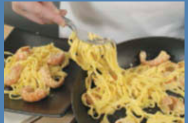
Mescolate bene, impiattate e servite subito.