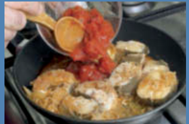
Aggiungete i pomodori pelati e portate a cottura.