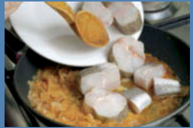
Mescolate e aggiungete il pesce, pulito e tagliato a pezzi.