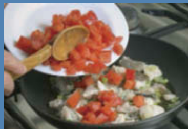
Aggiungete infine i pomodori perini a dadini.