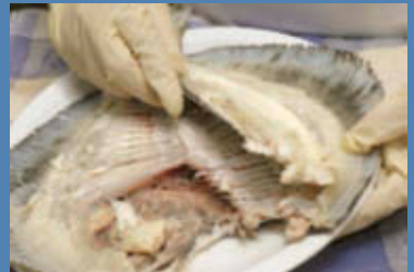
Sfilettate il pesce badando a non rompere i filetti.