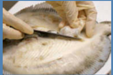
Scolate il rombo ed eliminate accuratamente la pelle.