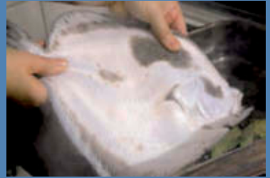
Cuocete il rombo in acqua e aceto con qualche foglia di alloro.