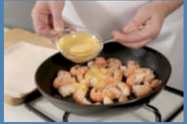
Fate saltare in olio caldo gli scampi con la pasta di curry.

Fate cuocere le fettuccine, scolatele molto al dente e trasferitele nella padella degli scampi in modo che si amalgamino bene con la salsa al curry. Aggiustate di sale e di pepe e, se la salsa risultasse troppo densa, aggiungete qualche cucchiaino dell'acqua di cottura della pasta. Servite subito, guarnendo con qualche fogliolina di maggiorana.