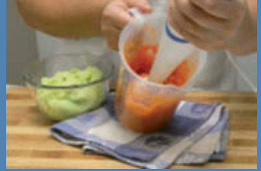
Passate separatamente le verdure bollite al mixer.

Cuocete il rombo in acqua bollente con sale, aceto e qualche foglia di alloro per 12 minuti. Scolate ed eliminate la pelle. Fate fondere in un padellino il burro rimasto e aggiungete i capperi. Posate al centro di un largo piatto da portata il pesce, disponetevi intorno i due purè di verdura, versatevi sopra la salsa di capperi e servite subito.