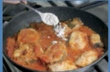
Alla fine legate il sugo con 1 cucchiaino di fecola.