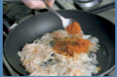
Aggiungete al soffritto di cipolle la paprica e l'aceto.

Accompagnate il gulasch con gnocchi di semolino.