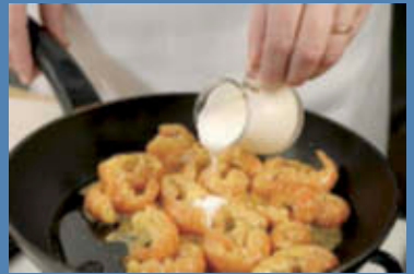
Quando saranno ben insaporiti, aggiungete la panna.