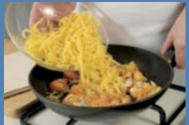
Scolate le fettuccine al dente e trasferitele nella padella.