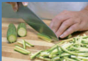
Lavate la zuccina, spuntatela e tagliatela a julienne.