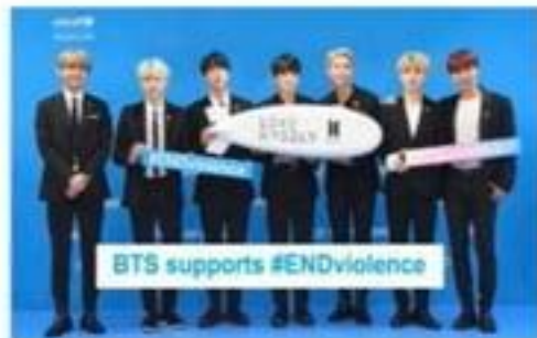
BTS ( penyanyi )