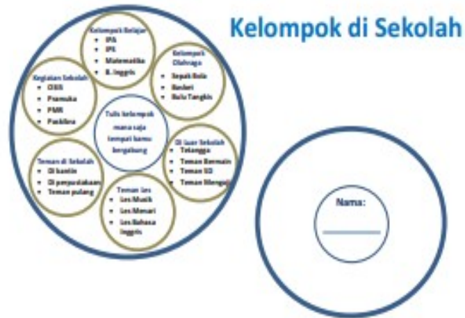
Lembar Kerja Kelompok

Coba lihat kembali lembar “kelompok di sekolah”, ini semua merupakan kelompok orang-orang yang bergaul bersama teman-teman, dan menghubungkan semua kelompok ini bersama-sama.