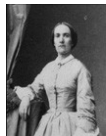
Victoire Julie DAUBIE (1824-1874)