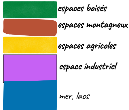
exemples de couleurs