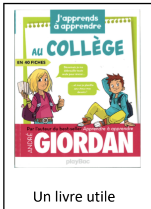
Un livre utile