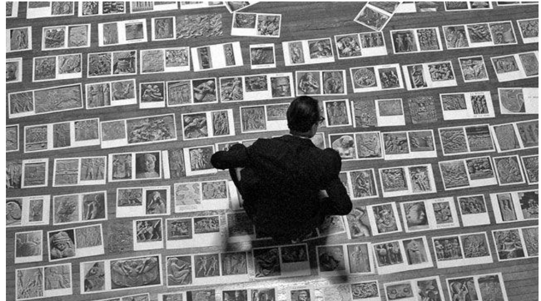
André Malraux, préparation du « Musée imaginaire », 1947