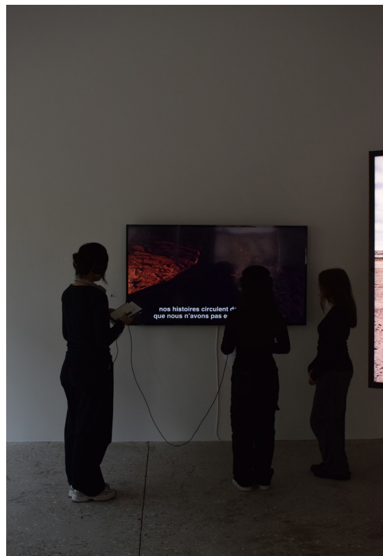
Visite de l'exposition d'Abdessamad El Montassir, Adagp, Paris, 2023 / Abdessamad El Montassir.

Lors de cette visite, non seulement les élèves ont pu s'immerger dans l'univers de l'artiste et clarifier les différentes étapes d'une visite d'exposition, mais ils ont pu commencer aussi à se projeter dans le rôle de médiateur · ices.