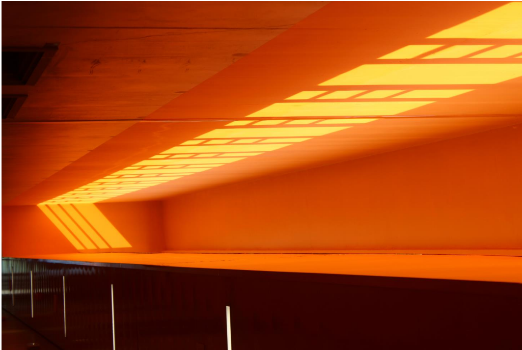
« Curiosité et Etrangeté » ou « Curieuse Orangite » Elèves de l'Atelier des Arts Visuels du Lycée A NOBEL de Clichy sous Bois

Les élèves de l'Atelier des Arts Visuels, dont certains sont issus de la classe de 2 nd Option Arts Plastiques.