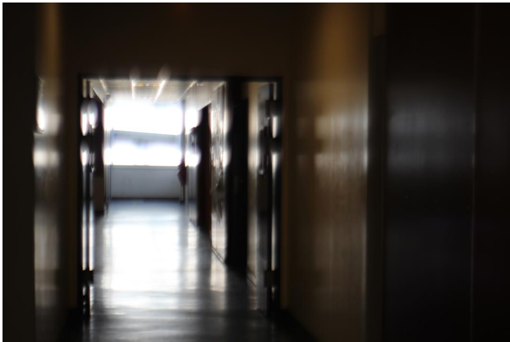
« Trouble Paradoxe » Elèves de l'Ateliers des Arts Visuels du Lycée A. NOBEL de Clichy sous Bois