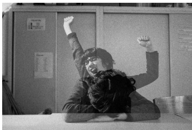
Figure 2: Photographie utilisant la double exposition dans le cadre de thème "éveil" travaillé au premier trimestre

Les élèves ont également expérimenté différentes techniques, allant de la photographie argentique à la photographie numérique, en utilisant divers médiums comme des tablettes, des appareils photo numériques reflex, ainsi que des appareils argentiques en petit et moyen format. Certaines techniques plus poussées, tel que la double exposition ainsi que la pause longue ont pu être aussi exploré à travers divers projets. Cette diversité d'outils leur a permis de comprendre les spécificités de chaque procédé et d'explorer différentes manières de produire une image.