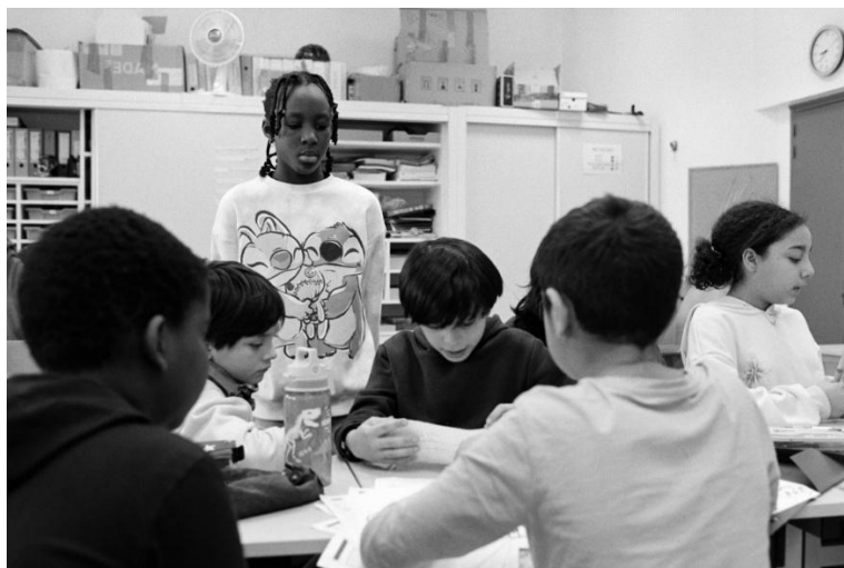
Figure 4 : Groupes de travail réalisant leur proposition de photo répondant un thème Image et Quotidien

Dans le cadre du concours photo Photofocus, les élèves ont été amenés à suivre plusieurs étapes de réflexion et de création.