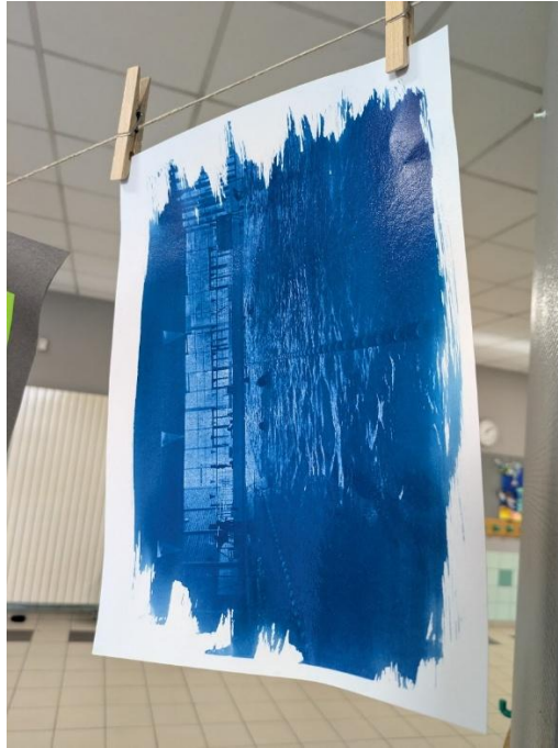
Figure 3 : création de cyanotype à partir d'un négatif

Enfin, ils ont prolongé cette expérience par la réalisation de tirages sous forme de cyanotypes, qu'ils ont utilisés pour exposer leurs productions. Ce travail d'exposition valorise les créations réalisées tout au long de l'année et met en lumière leur capacité à interroger le quotidien à travers la photographie.