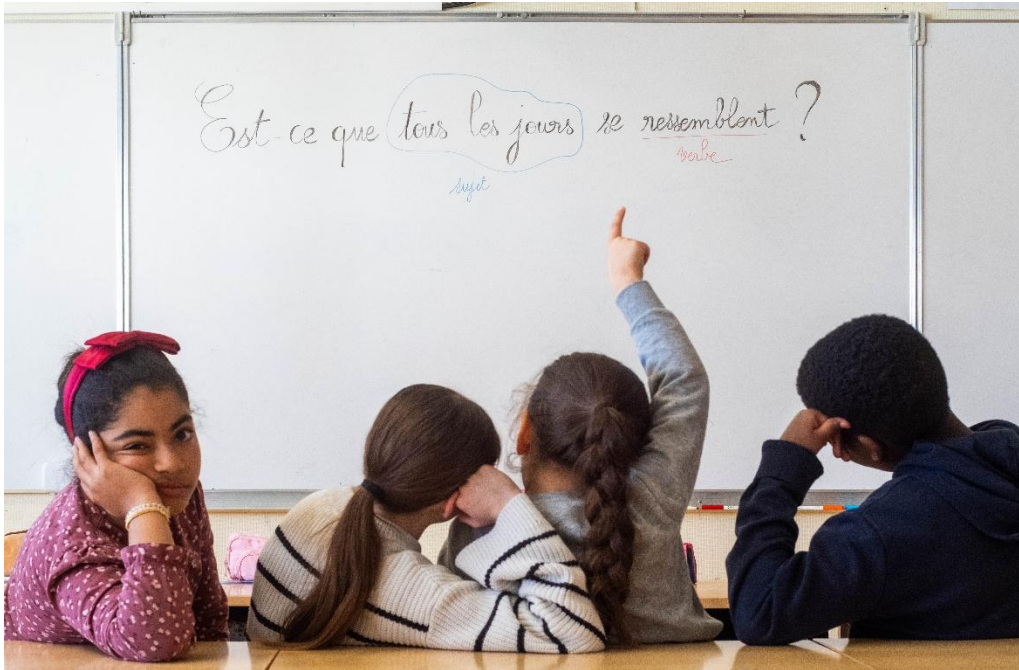
Figure 7 : Routine

Cette photographie, Routine , présente une scène de classe qui invite à réfléchir sur le quotidien, en particulier dans le contexte scolaire. On y voit des élèves assis face à un tableau sur lequel est inscrite la question : « Est-ce que tous les jours se ressemblent ? ». Cette phrase oriente immédiatement l'interprétation et place au cœur de l'image une réflexion sur la routine et la répétition dans la vie de tous les jours.