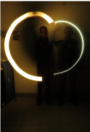
« Créer ensemble »