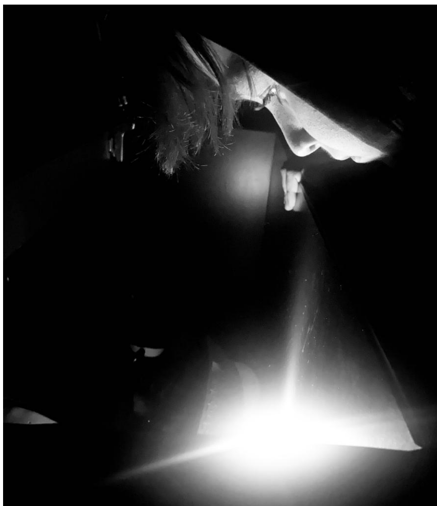
Attraction , classe de 5 ème C

Enseignant référent : Mme Coline SAGNE Classe de 5 ème C