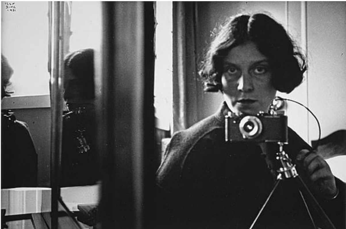
Ilse Bing, Autoportrait au Leica (1931)

Une histoire de la photographie pourrait consister à retracer, telle une épopée visuelle, les « faits et gestes » du médium comme on le disait des grands personnages à l'époque classique. Depuis son invention et son essor au cours du XIXe siècle jusqu'aux révolutions technologiques et sociétales qu'elle accompagne du XXe siècle à nos jours, la photographie implique dans ses pratiques et dans ses usages des dispositions particulières qui sollicitent le corps du modèle et du photographe, des deux côtés de la caméra. Des gestes en tous genres sont présents dans tous les temps de l'image, de la réalisation de l'action à sa captation, de l'élaboration du tirage à son exposition.