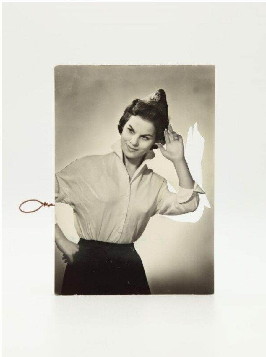
Kensuke Koike Laundry (2018) – carte postale retouchée

Accès au site de ressources : Cliquer ICI