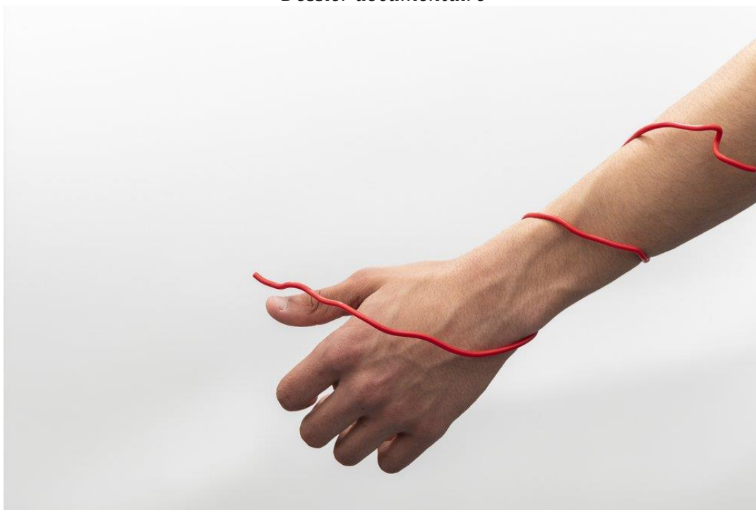
Gilberto Güiza-Rojas Le bon geste (2023)

Série réalisée dans le cadre de la résidence de co-crédation artistique avec les élèves des classes d'ébénisterie, menuiserie et réparation moto du lycée Jacques Brel (Choisy-le-Roi, Val-de-Marne). En conception avec Claire Boucharlat. Avec le soutien de la DRAC Île-de-France, du CIP (Collège international de photographie) et de l'académie de Créteil.