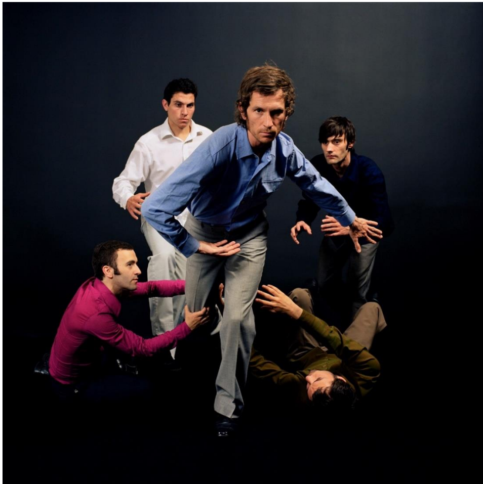
Edouard Levé, sans titre , série Rugby (2003) © Edouard Levé / Galerie Loevenbruck, Paris.

La photographie, régime particulier de l'image, a donc le geste large : elle donne corps aux images qui nous constituent. Ancrée solidement dans nos pratiques sociales et culturelles, elle est, en toute occasion, le miroir figé et réinventé de nos faits et gestes.