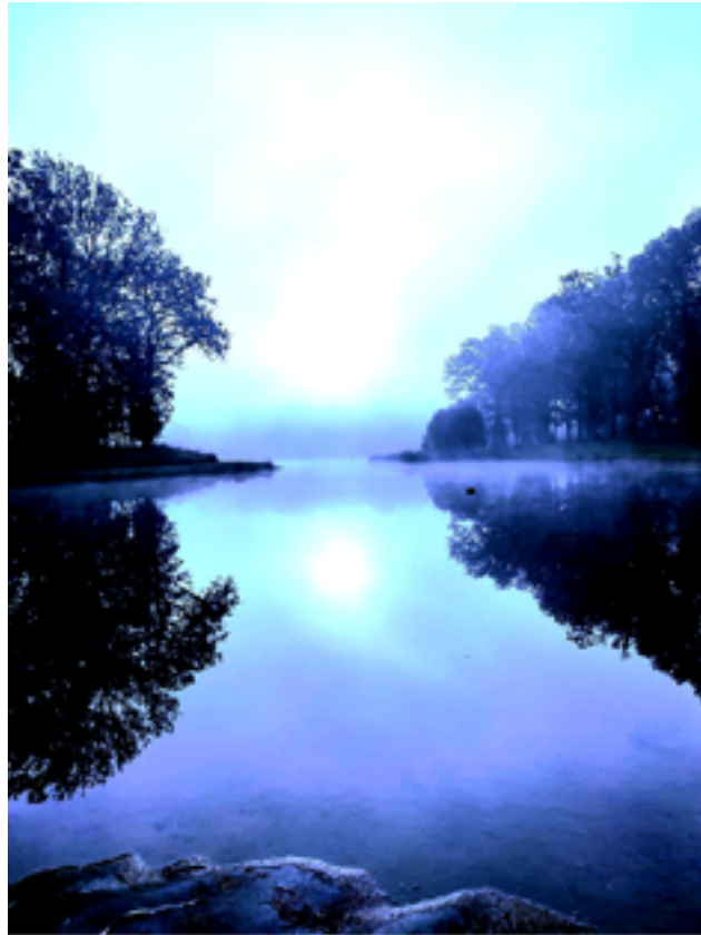
« Horizon »