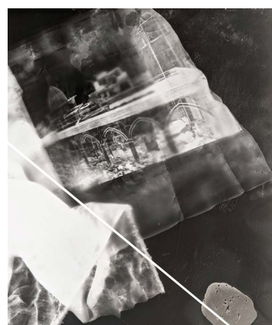
Franck de Villecholle — Ruines du Château de Saint-Cloud 1871

Tirage sur papier albuminé © Les Arts Décoratifs