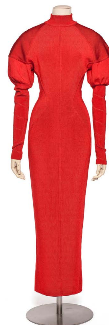
Madeleine Vionnet, 1938 — Présentée à l'exposition « Madeleine Vionnet » (2009)