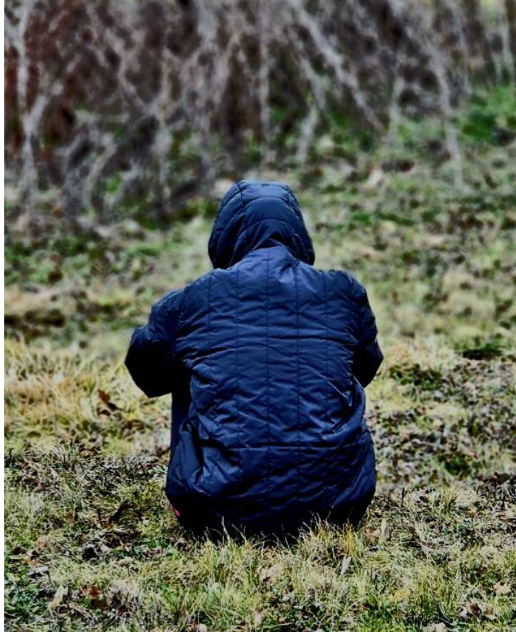
Sans titre , Classe de 4 ème D