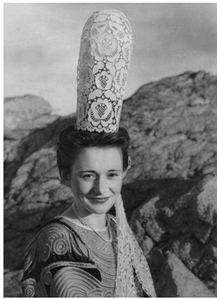
Bigouden Bretonne. Dentelle