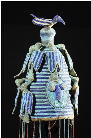
Coiffe-ade-Yoruba, Benin. Perles

Toutes les coiffes partout dans le monde peuvent servir à se protéger contre les éléments (pluie, soleil), à imiter les animaux (aussi bien dans leur aspect physique que dans leurs traits de caractère). Elles peuvent aussi indiquer la place que chacun occupe dans la société (chef, roi), donner des informations sur la religion, le métier ou encore être une parure de théâtre et dans la vie quotidienne.