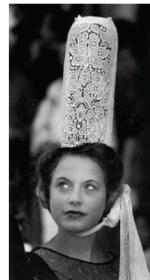
Bigouden , coiffe traditionnelle bretonne