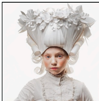
Perruques Asya Kozina