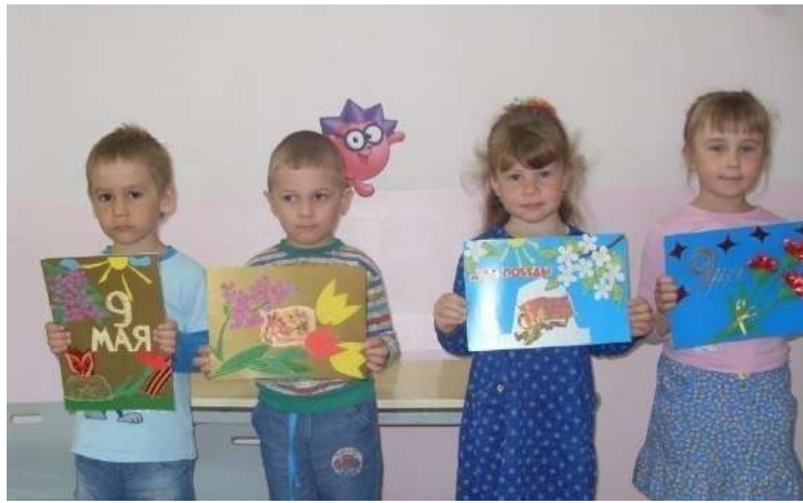
Акция « Открытка ветерану»