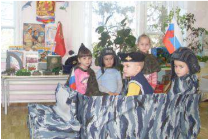
Сюжетно ролевая игра «На посту»