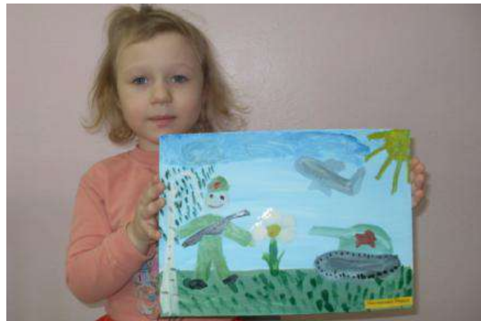
Открытка « 23 февраля»