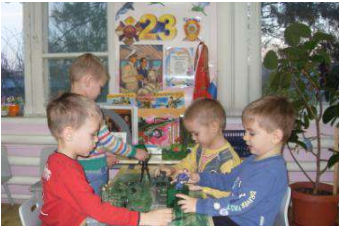
Игра «На заставе»