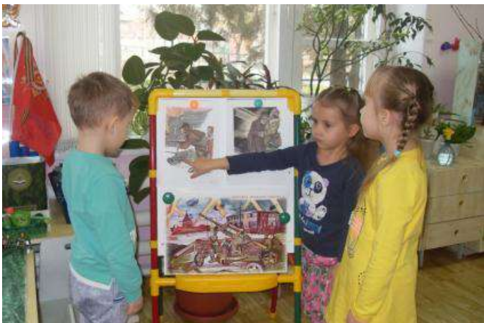
Беседа с детьми « Дети на войне»