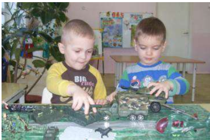
Сюжетная игра « Грянул бой»