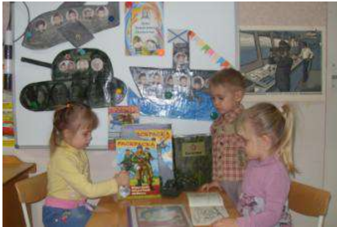
Рассматривание альбома « Наша армия»