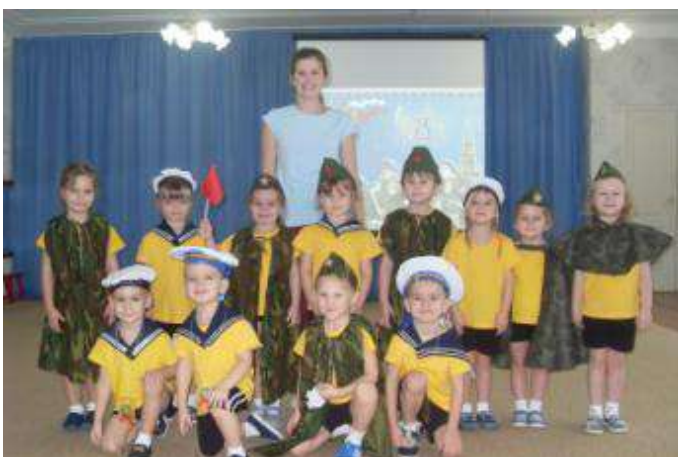
Спортивное развлечение «Самые ловкие и смелые»