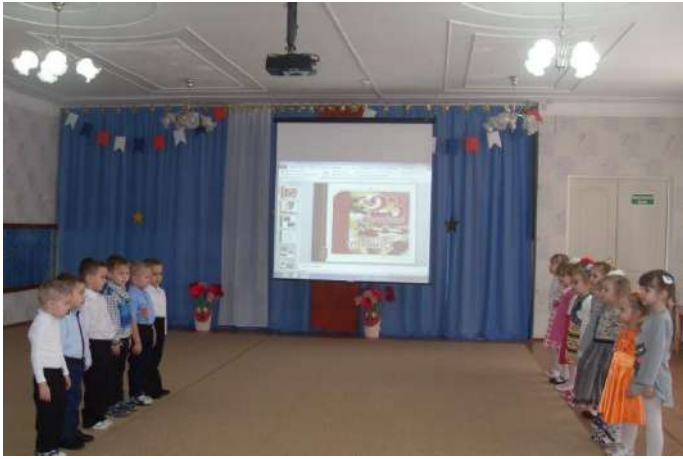
Праздник « Воинский долг- честь и слава»