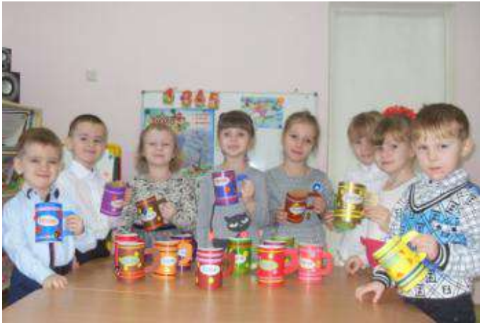
Подарки папам и дедушкам