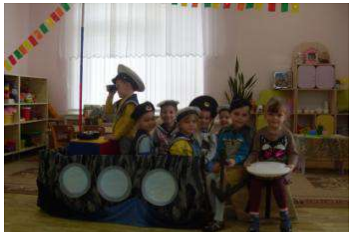
Сюжетно- ролевая игра « Военные моряки»