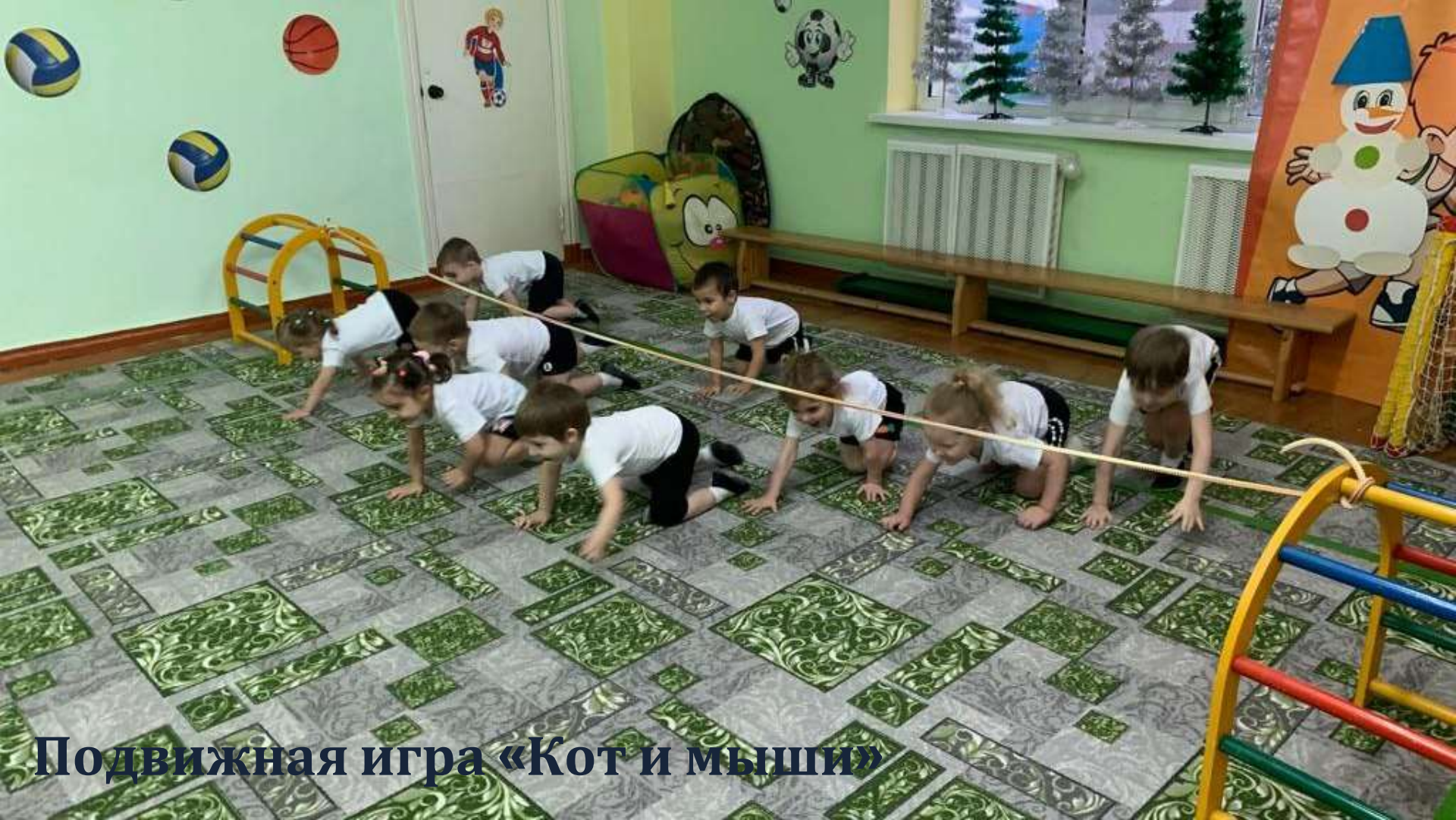
Подвижная игра «Кот и мыши»