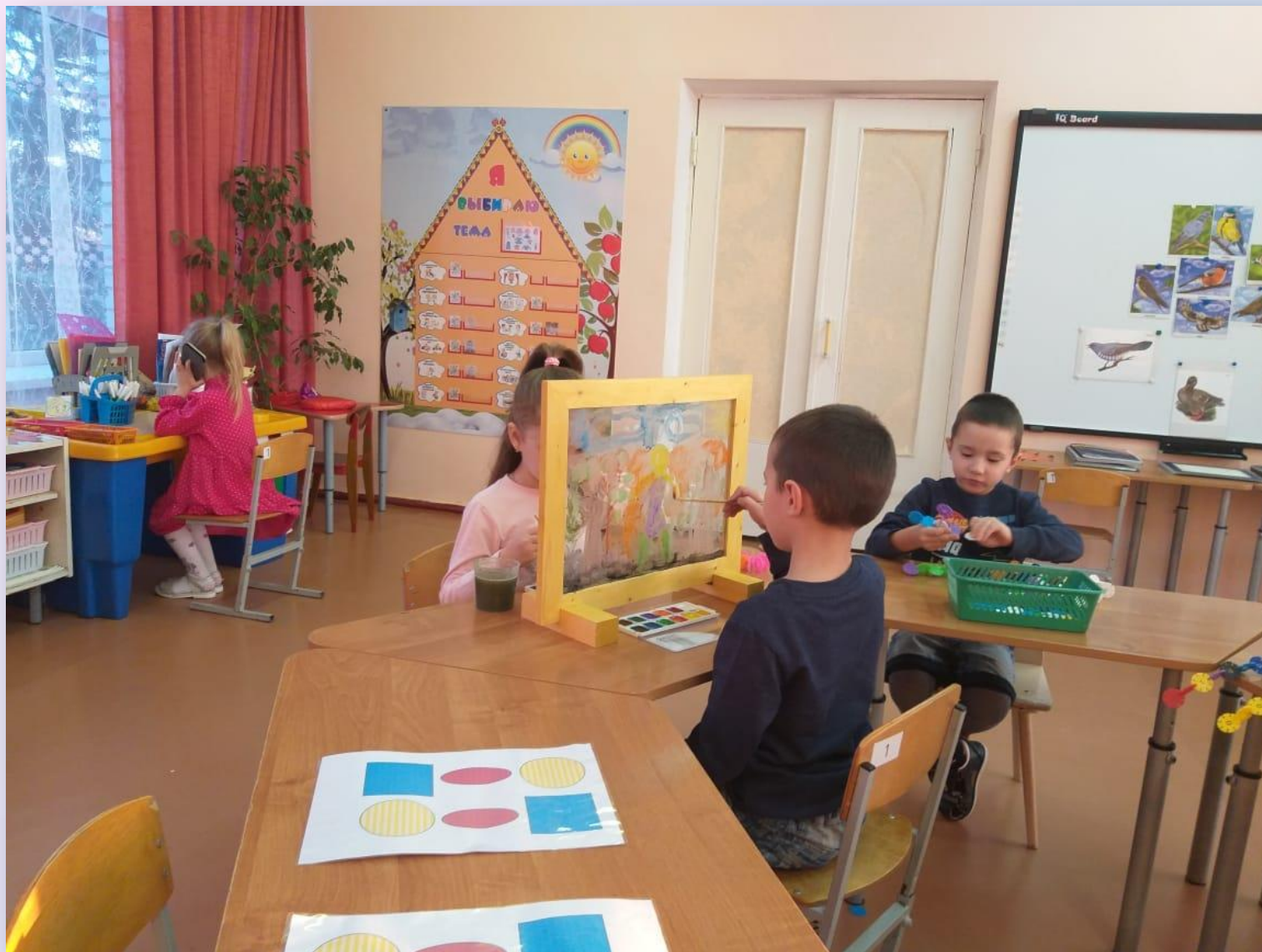
Рисование по сказке «Сказочный город»