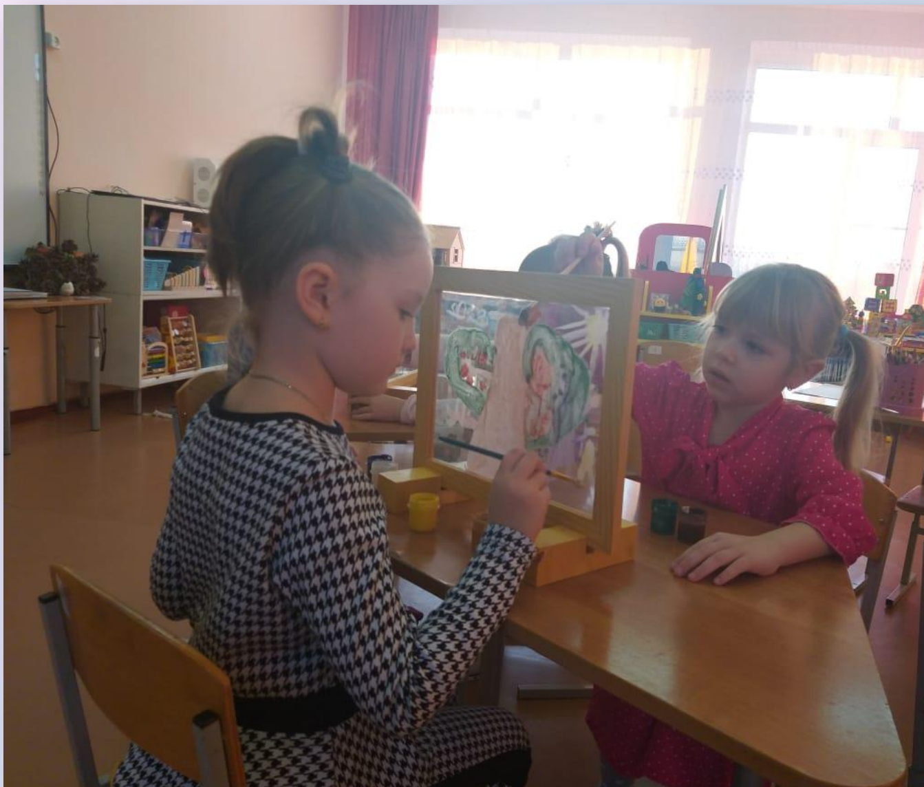
Творческое упражнение «Расскажи сказку»