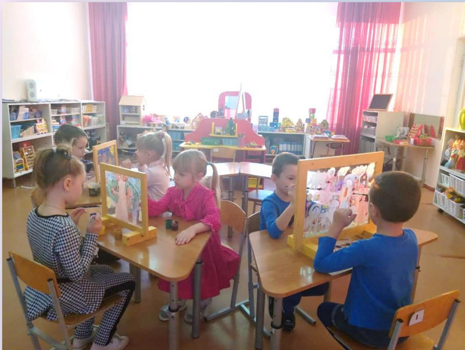
Рисование по сказке «Петух и краски»