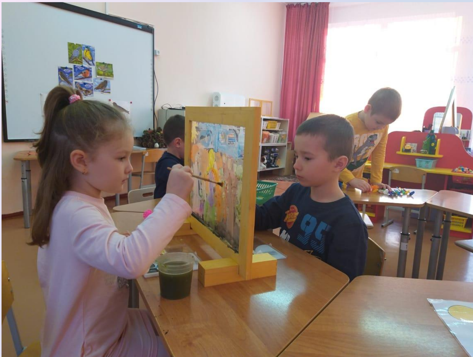
Рисование по сказке «Кленовый лист»