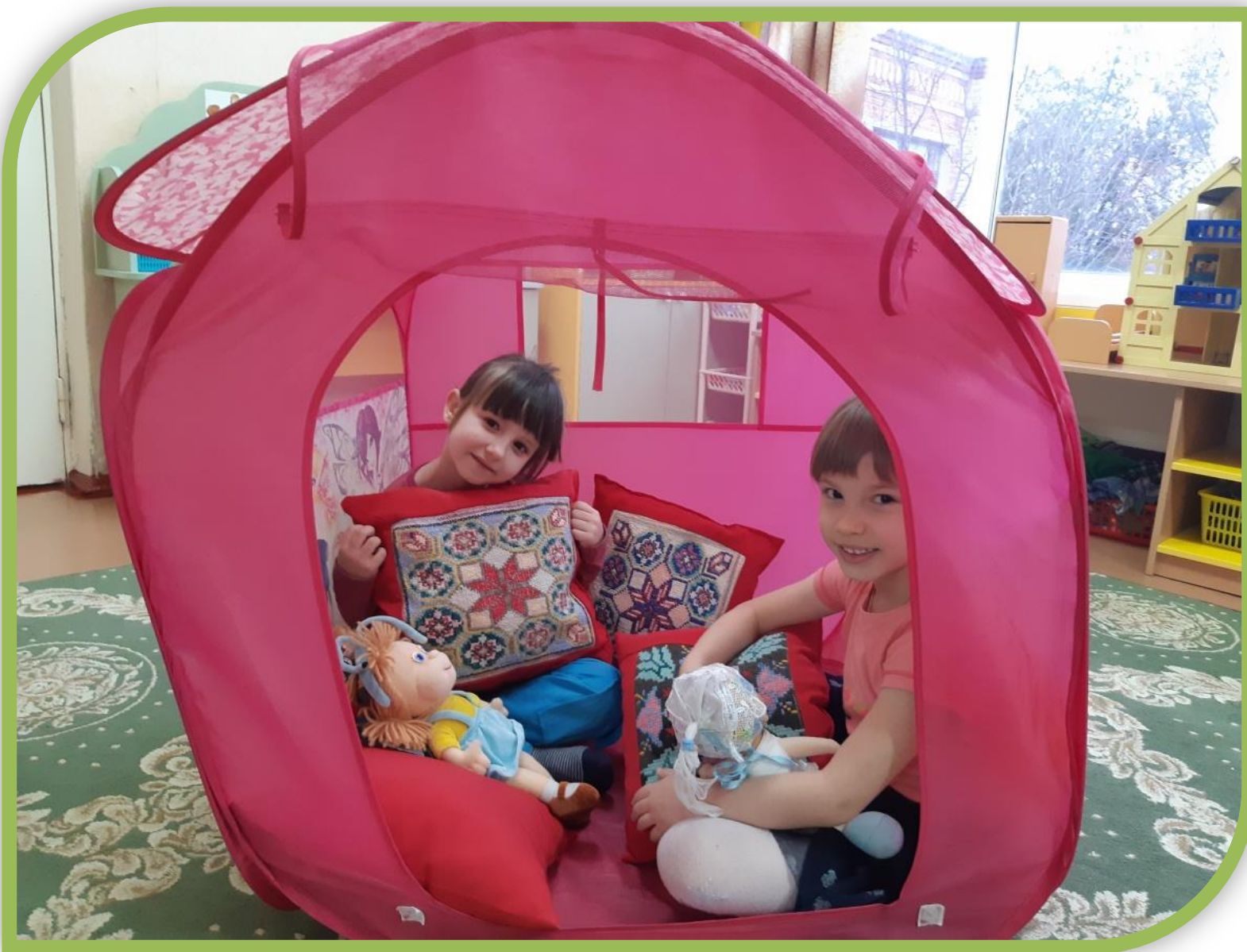
Игра с вышитыми подушками