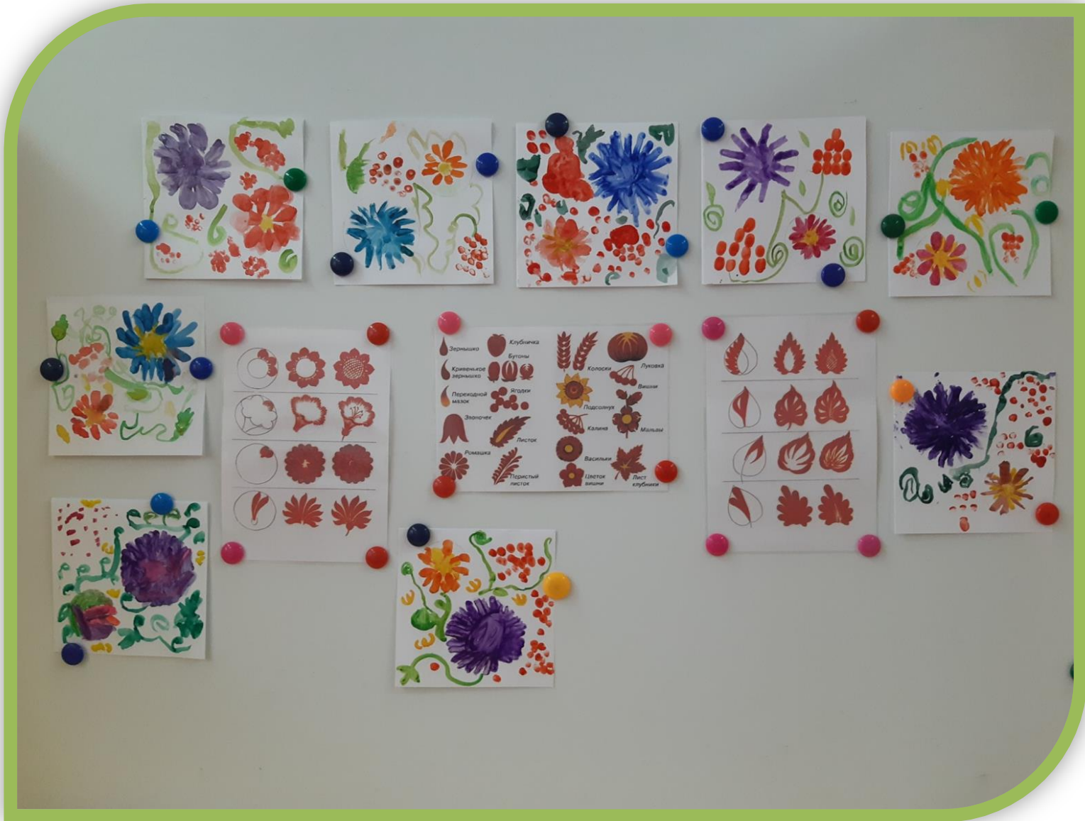
Открытка для мамы