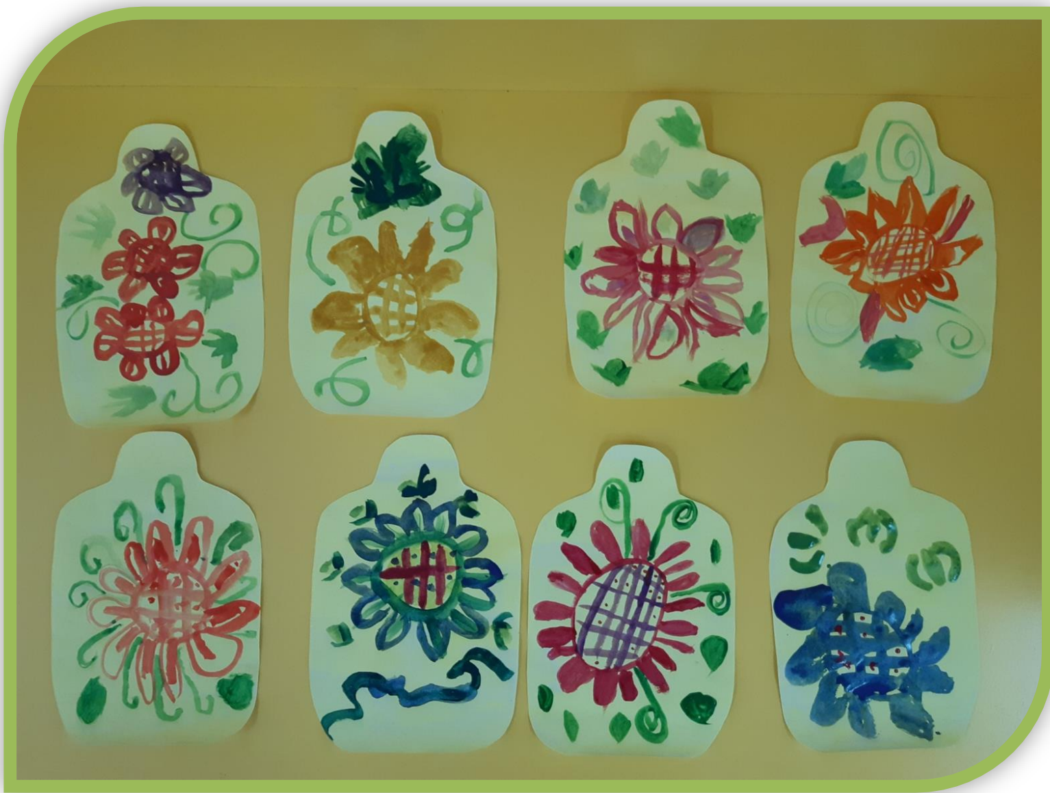
«Украсим кухонную доску»