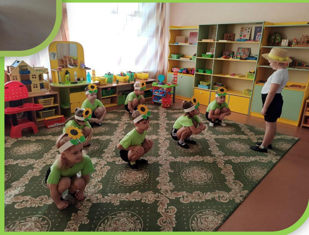
П/ игра «Подсолнухи»