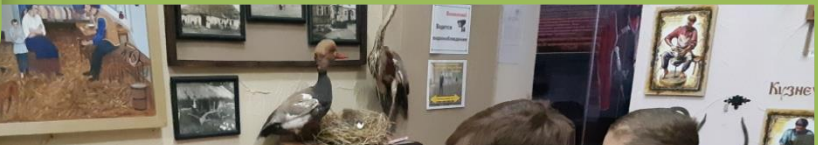
Экскурсия в краеведческий музей