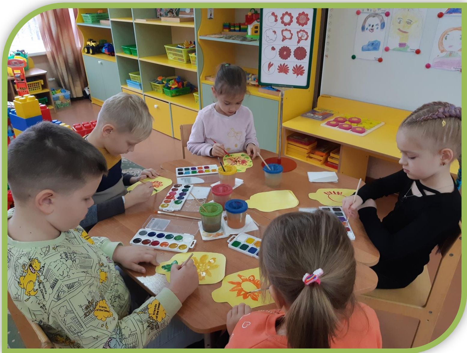
Учимся рисовать элемент «Подсолнух»