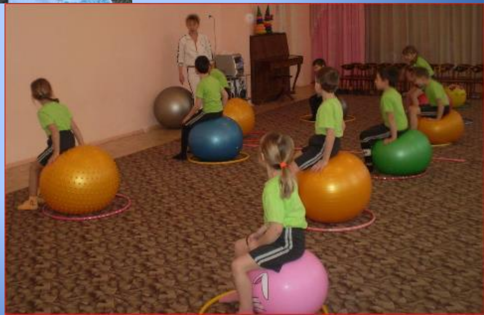
Тематическое физкультурное занятие "Я в военные пошел - пусть меня изучат!"