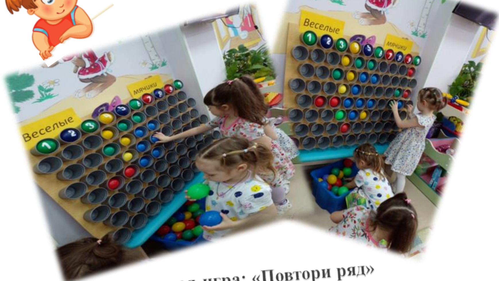
Дидактическая игра: «Повтори ряд»