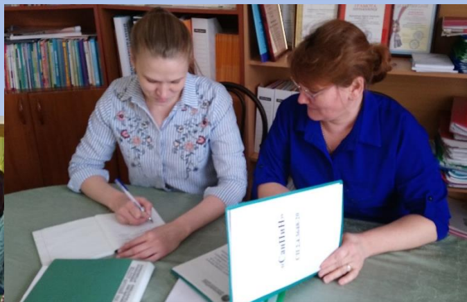
Практикум по решению педагогических ситуаций