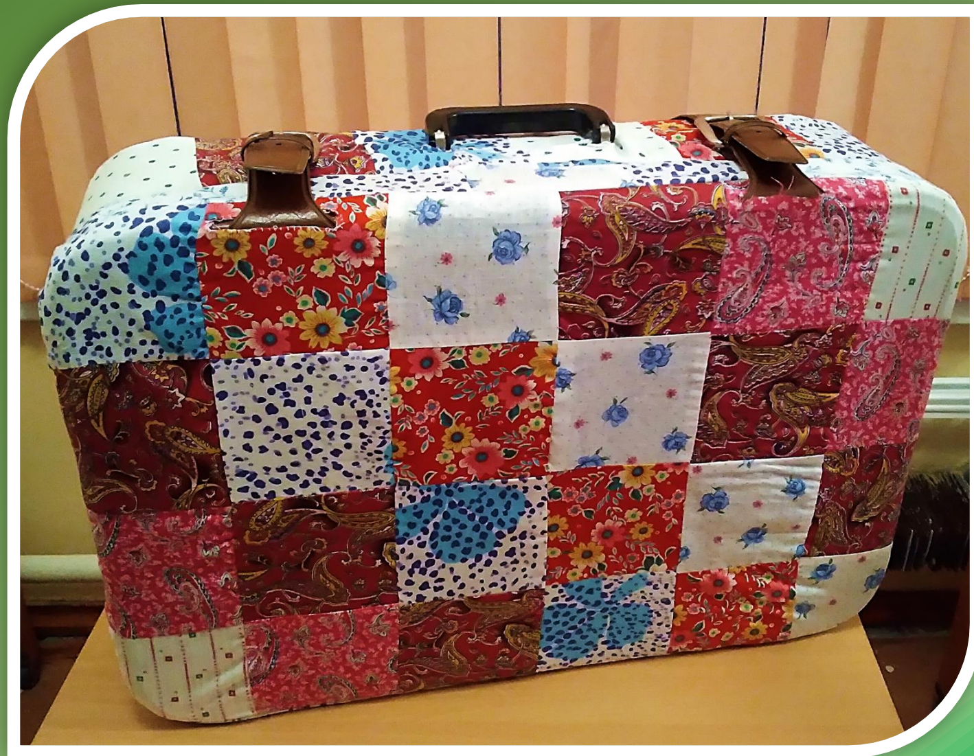
Чемодан «Мини – музей «Казачий курень»