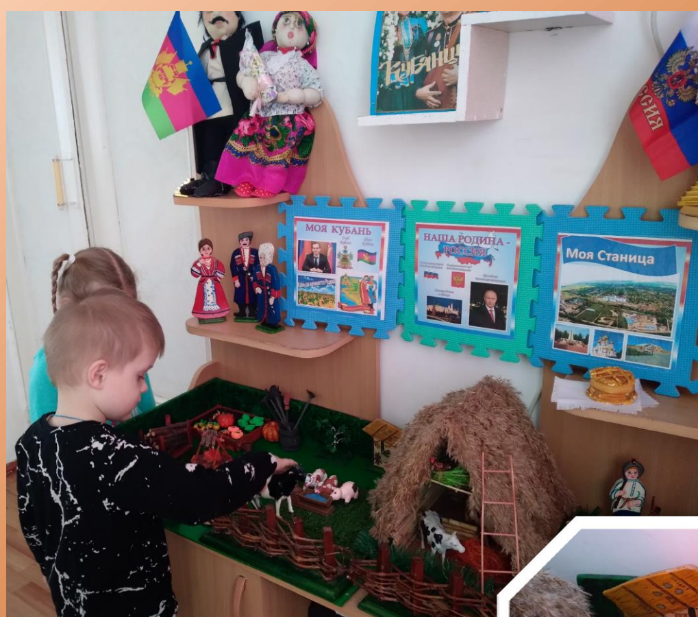
мини - музей «Подворье казака Григория».