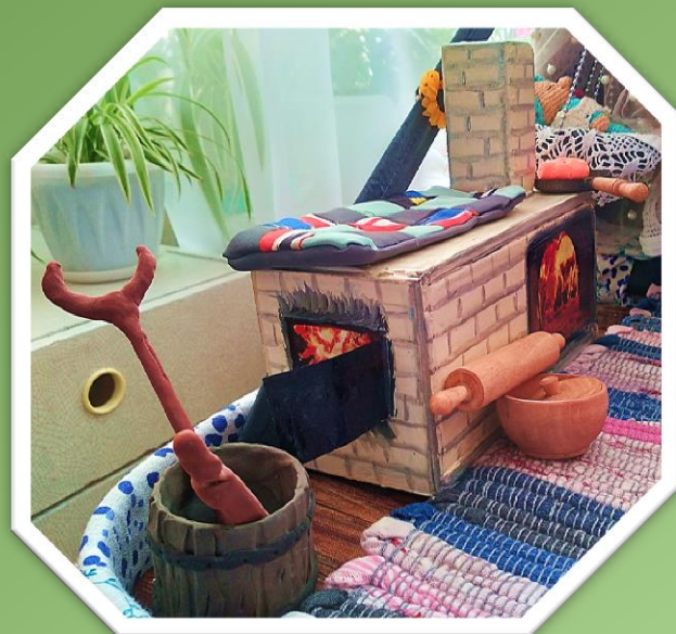
Работа семьи Вероники Ч.