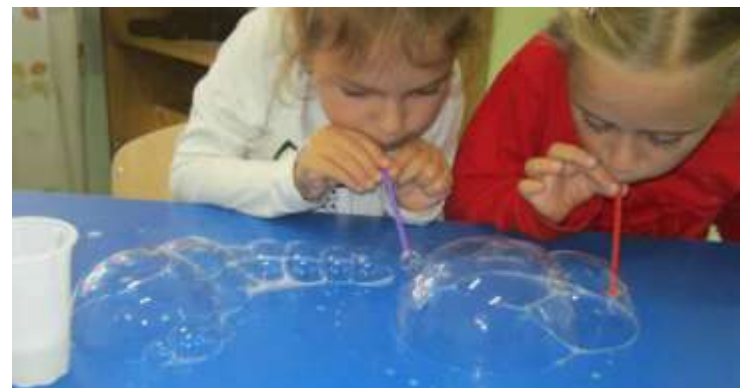
Игра «Подуй на пузырь»