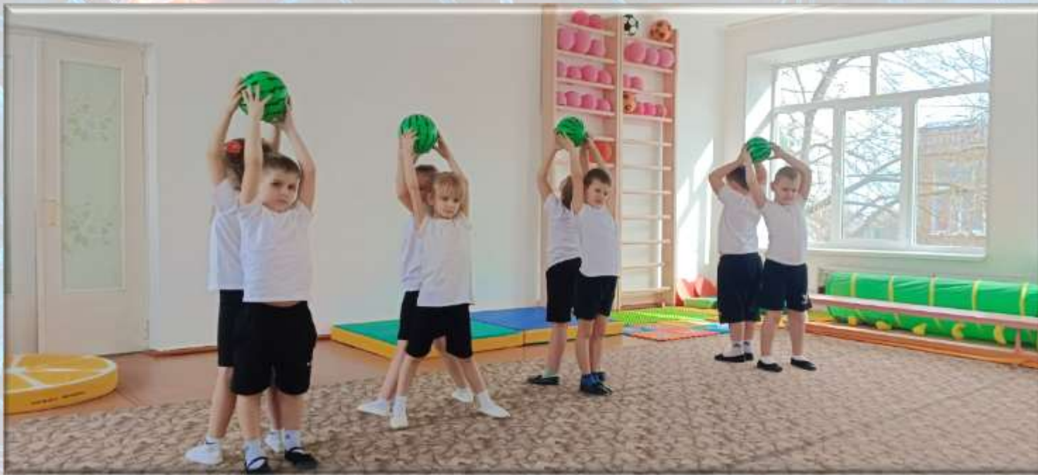
Упражнение «Передача мяча в парах»