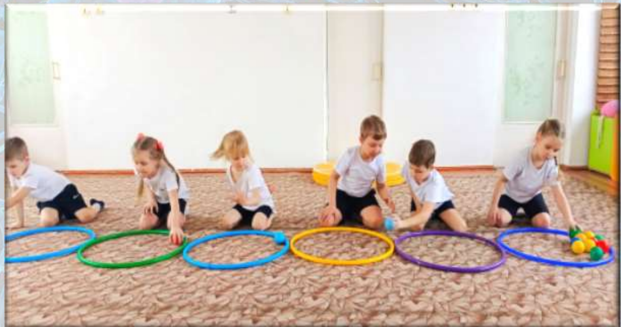
Упражнение «Передай мячик следующему»