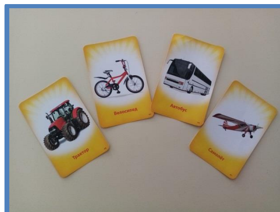
Карточки для игрового упражнения «Скажи иначе»