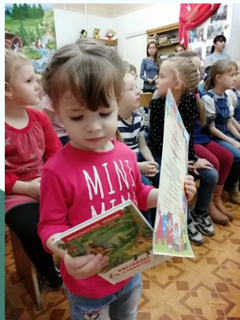
Акция «Подари книгу библиотеке»