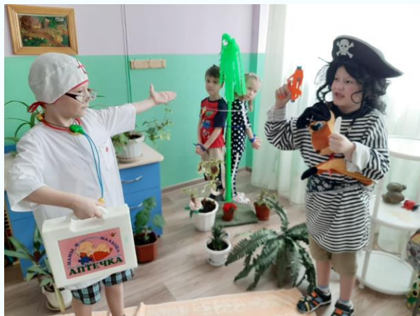
Челендж «Книжкаина неделя»