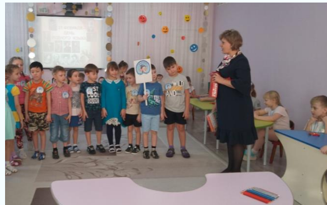
Квест «По страницам умной книги»