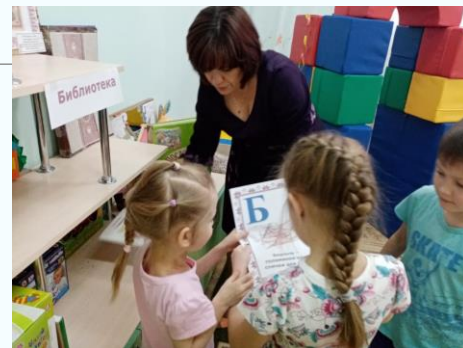
Флешмоб «Быть грамотным модно»