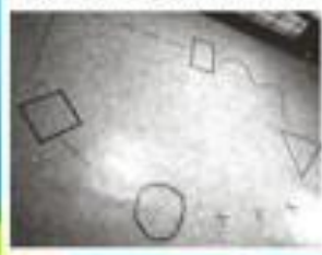
Пример игрового поля

Подумав вместе с детьми, какие упражнения будут включать зарядка, нанесите на поверхность пола с помощью изоленты, придуманную схему. Пример упражнений. Квадрат – 5 раз присесть, линия Л – пропрыгать на левой ноге, пунктирная линия – пройти на носочках, прямоугольник – наклоны головы, волнистая линия – пройти на пяточках, треугольник – 5 раз приседание, крестики – прыжки на двух ногах, круг – наклоны вперед, линия П – пропрыгать на правой ноге. Рекомендации. Данный комплекс упражнений тренирует память, внимание, закрепляет физические навыки, так как дети передвигаются по игровому полю. Во время придумывания схемы передвижения развиваются творчество и фантазия. Его можно использовать как элемент утренней зарядки или физ минутки.