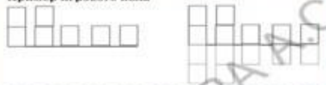
Пример игрового поля

В процессе выполнения тренируются внимание, пространственное восприятие. Присутствует двигательная активность: ходьба, наклоны.