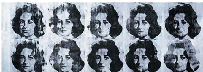
◀ Ten Lizes , 1963, Encre sérigraphique et peinture à la bombe sur toile, 2 x 5,6m.