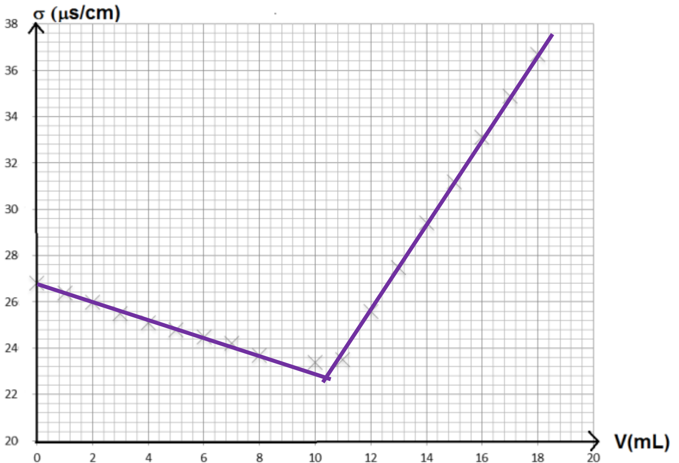
Figure 1 : conductivité \sigma en fonction du volume V de la solution aqueuse de nitrate