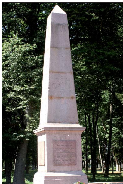
Памятник Уланскому полку

В 1812 году уездный город Красный первым принял на себя грозный вал неприятельского нашествия и стал известен во всем мире героическими сражениями русских воинов с войсками французского императора Наполеона Бонапарта.