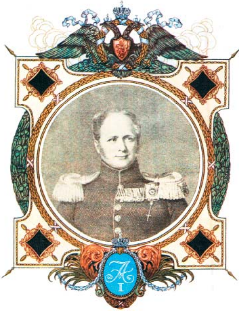
ИМПЕРАТОР Александр Павлович

1812 г. июня 13. — Рескрипт Александра I председателю Государственного совета и Комитета министров фельдмаршалу Н.И. Салтыкову о вторжении армии Наполеона и начале военных действий