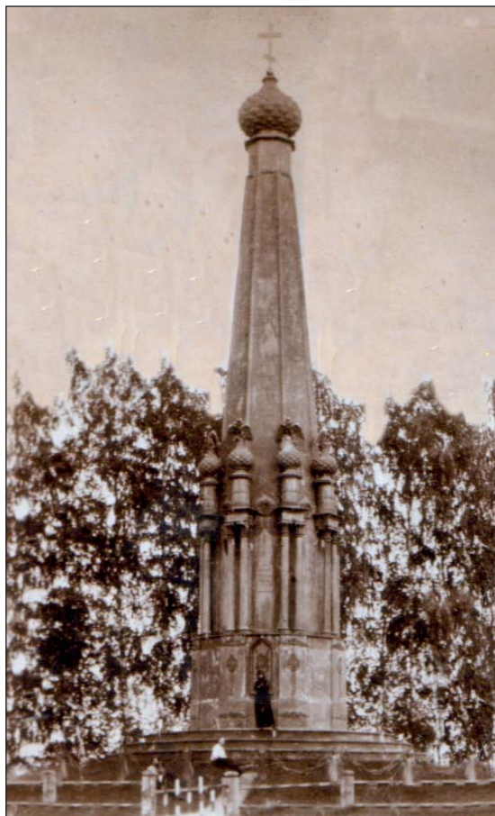
Памятник в ознаменование побед русских под Красным (не сохранился)

Именно здесь, на краснинской земле, произошли два значимых сражения, исход которых определил дальнейший ход войны.