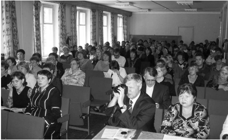
Всероссийский семинар-совещание руководителей в г. Москве

щена в холле второго этажа Федерального центра. Недостаток времени не позволил всем в полной мере изучить интересные музейные артефакты.