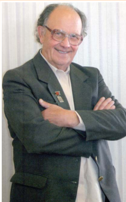
Панин Н.И. (1927—2005)