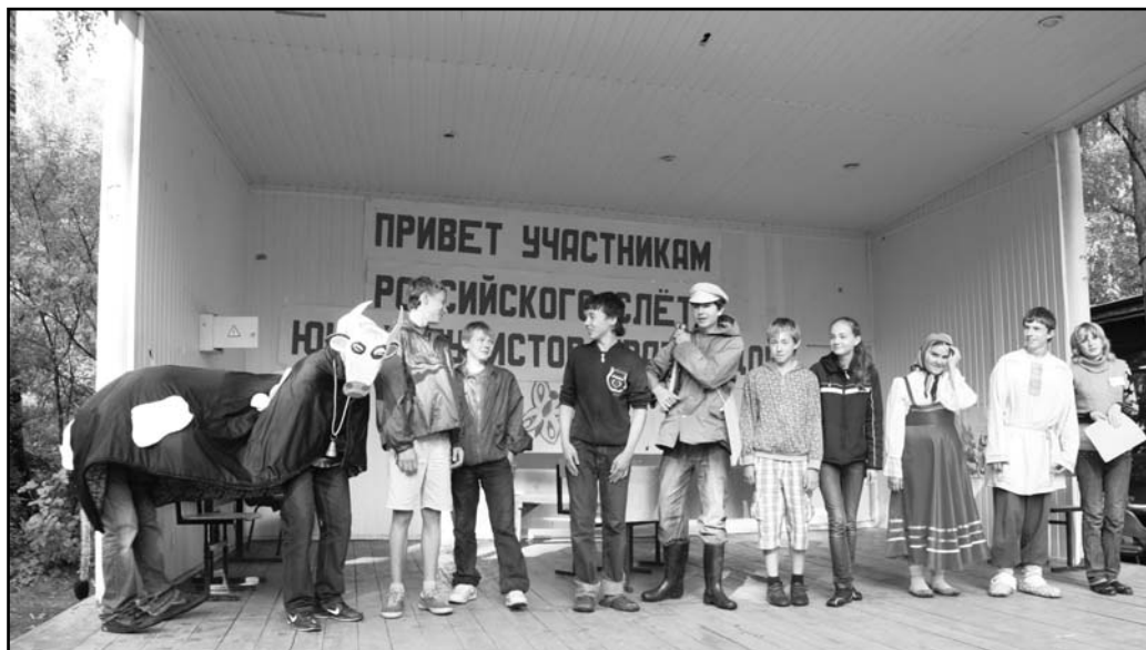
Елабуга 2009. «Игра».

развернет своих человеческих потенциал. Игра формирует интеллектуальные и физические особенности, с которыми ребенок будет жить долгие годы».