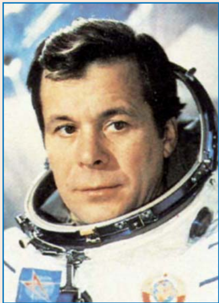
Лётчик-космонавт Е.В. Хрунов

10 сентября 1933 года — родился в деревне Пруды Воловского района Тульской области в большой крестьянской семье.