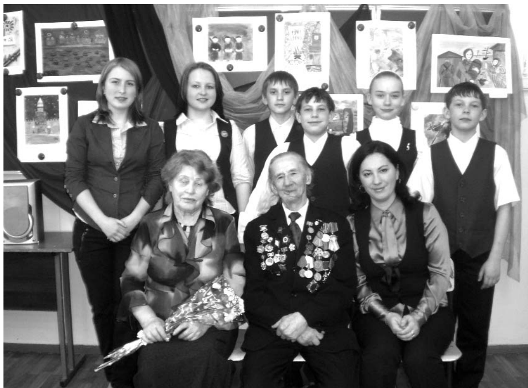
В школьном музее. Встреча с ветеранами войны

но-спортивном смотре строя и песни; акция «Я — гражданин России»; деятельность подросткового туристско-краеведческого клуба «Друзья Заполярья».