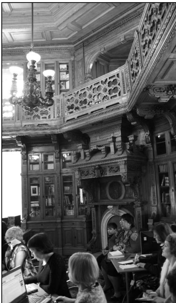
В библиотеке Аничкова дворца

Анализ выступлений учащихся подтверждает, что в целом в Российской Федерации учебно-исследовательская деятельность в области школьного краеведения успешно развивается, повышается уровень работ, их качество, расширяется тематика работ, увеличивается практическое и общественно-политическое значение работ учащихся. Многие краеведы-туристы участвуют в практической работе по выявлению и сохранению природного и историко-культурного наследия Отечества: археологических, этнографических и экологических экспедициях, «вахтах памяти», работах по охране и восстановлению памятников культурного и исторического значения, обустройству родников, восстановлению численности животных, растительного покрова и в других практических действиях.